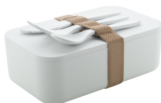
Planche Scatola pranzo in PLA

Scatola per il pranzo in plastica PLA con set di posate (forchetta, cucchiaio e coltello) e cinturino elastico in poliestere RPET, 1000 ml. PLA senza BPA, 100% compostabile.